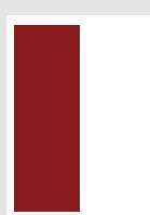
■ 1/2 Seite hoch 87 × 265 mm