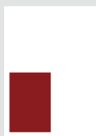
■ 1/4 Seite hoch 87 × 130 mm