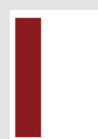
■ 1/3 Seite hoch 57 × 265 mm