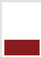
■ 1/3 Seite quer 178 × 86 mm