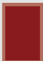
■ 1/1 Seite 210 x 297 mm ■ 1/1 Seite 178 x 265 mm