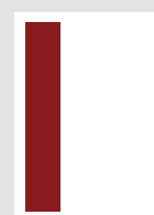
■ 1/3 Seite hoch 57 x 265 mm